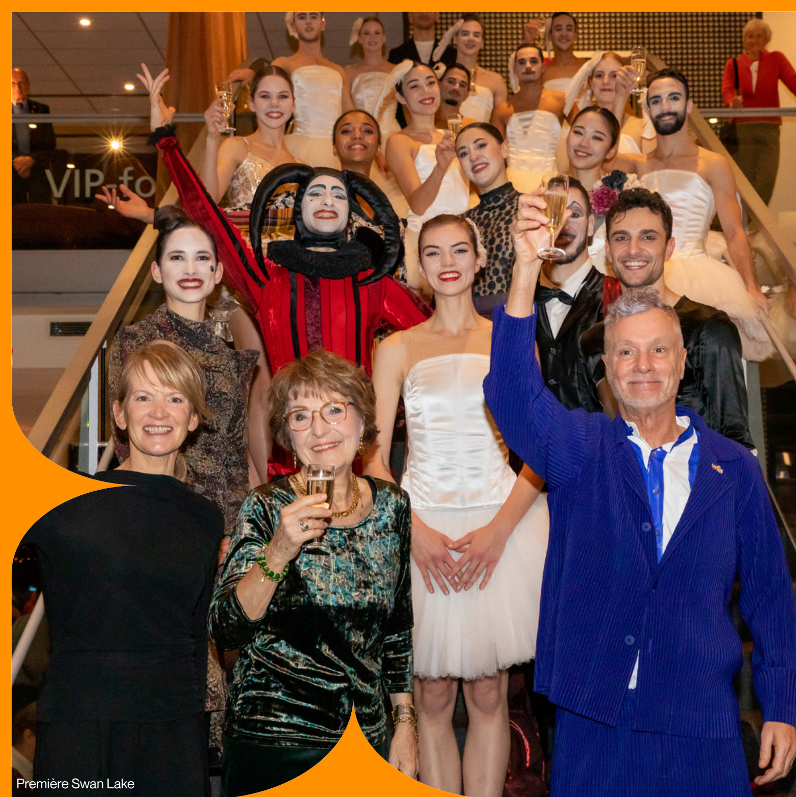
Première Swan Lake