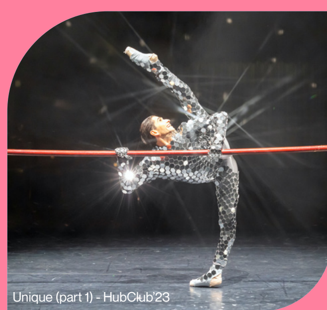
Unique (part 1) - HubClub'23