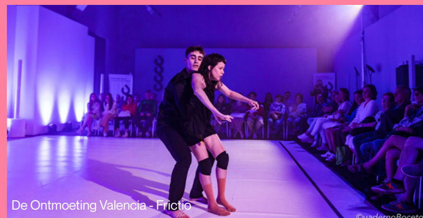
De Ontmoeting Valencia - Frictio