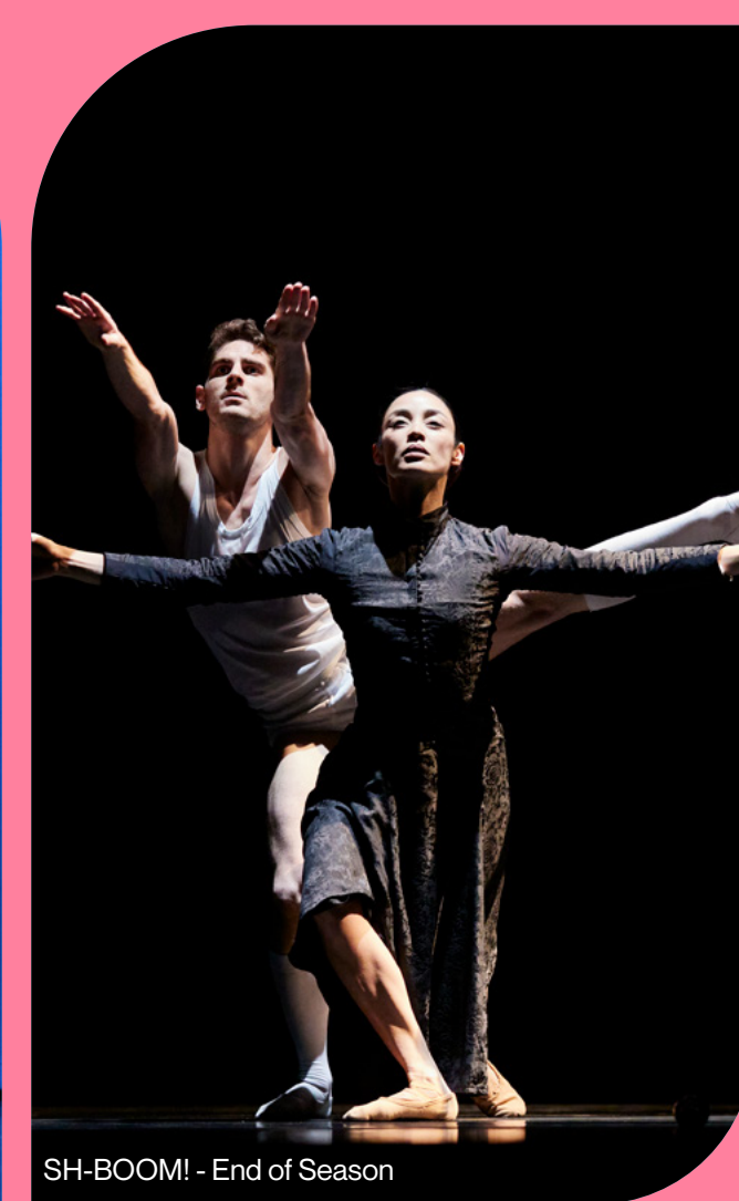
SH-BOOM! - End of Season