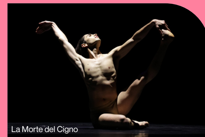
La Morte del Cigno