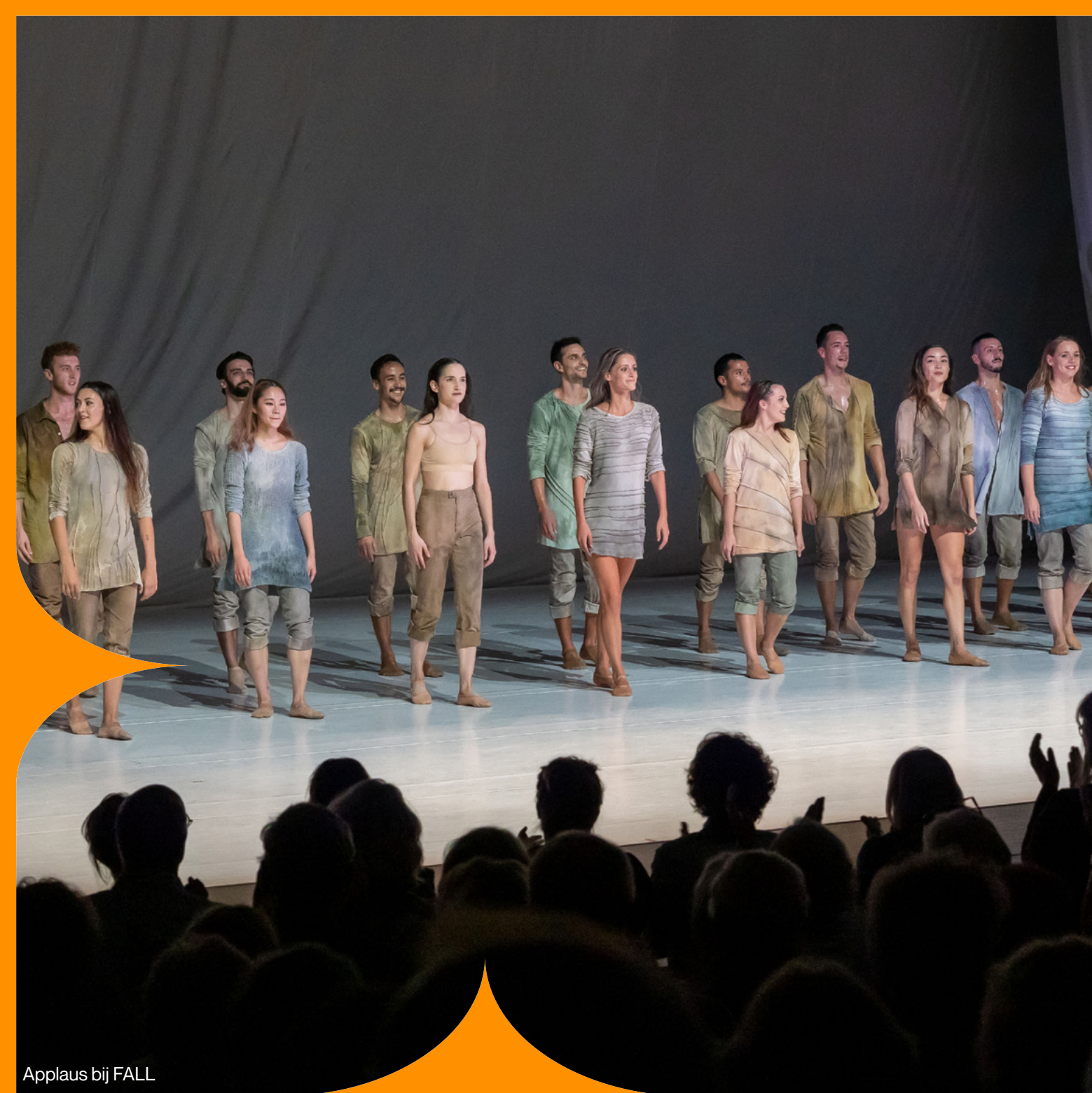
Applaus bij FALL