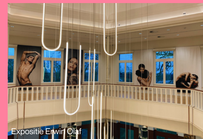
Expositie Erwin Olaf