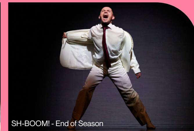
SH-BOOM! - End of Season