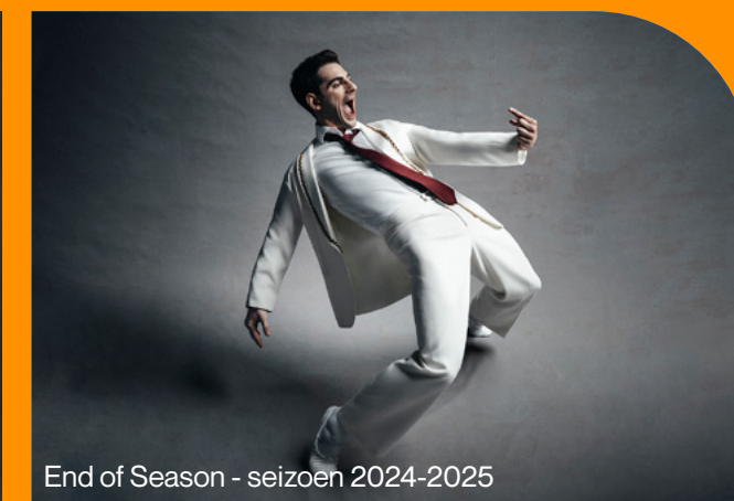
End of Season - seizoen 2024-2025