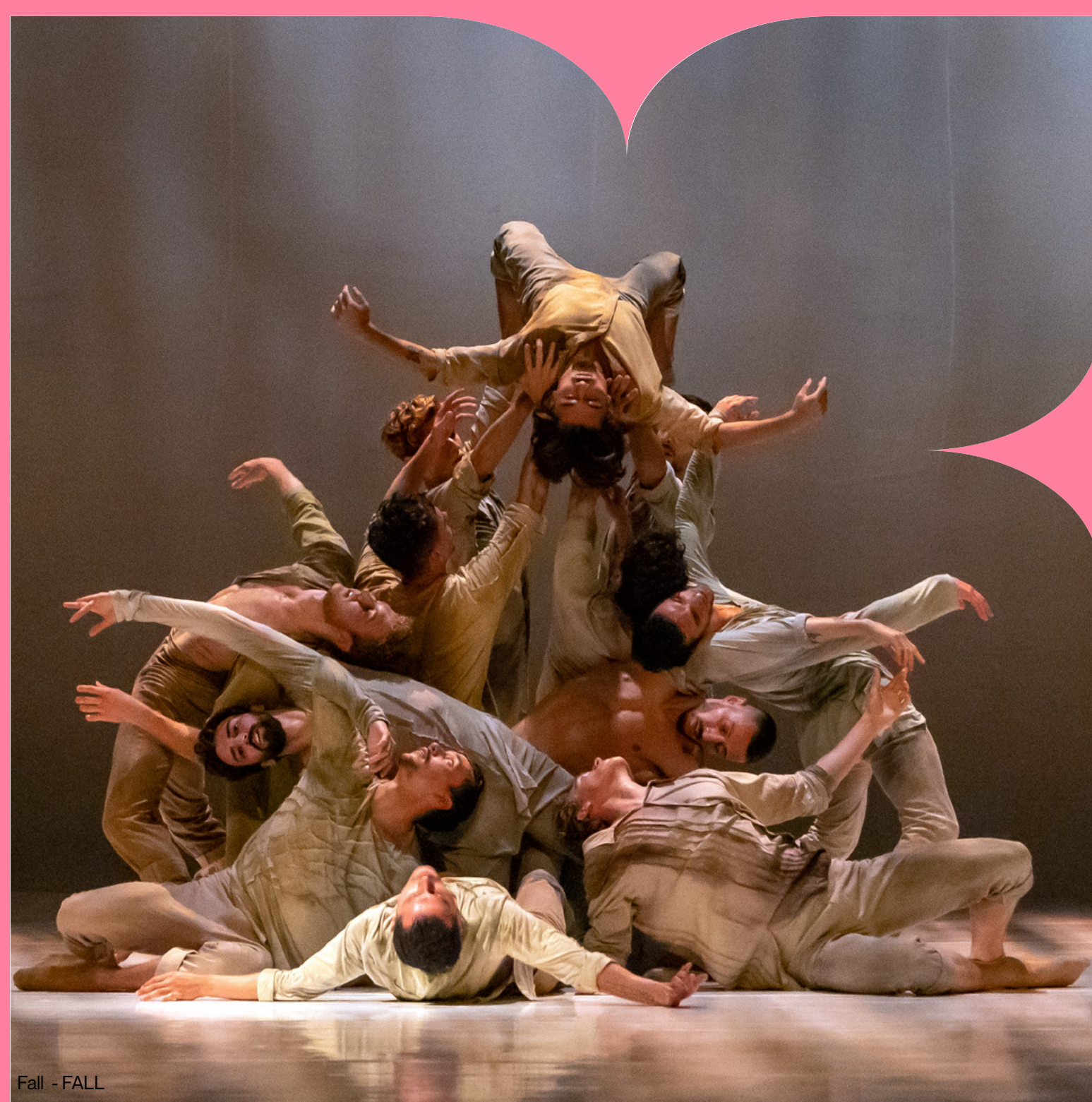
Fall - FALL