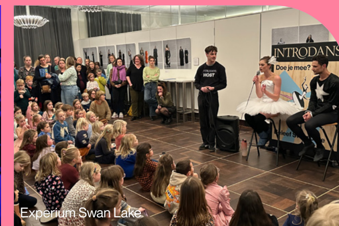
Experium Swan Lake