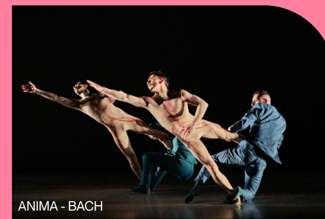
ANIMA - BACH