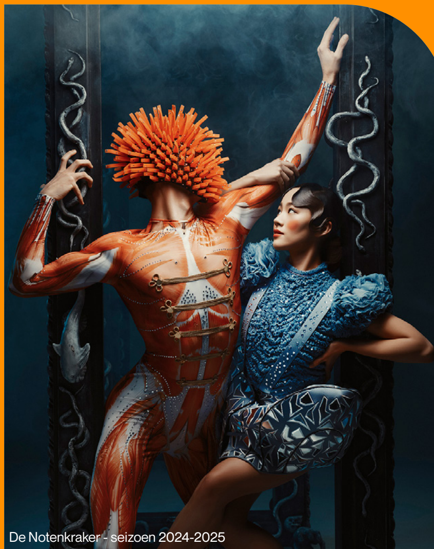
De Notenkraker - seizoen 2024-2025

De gemeente Arnhem en provincie Gelderland hebben elk 10 miljoen euro toegezegd voor de financiering van het nieuwe repetitiegebouw. Stead Advisory is gestart met een haalbaarheidsstudie naar de locatie rondom het Stadstheater voor de ontwikkeling van een duurzaam gebouw, dat zowel Introdans als Theater Oostpool zal huisvesten.