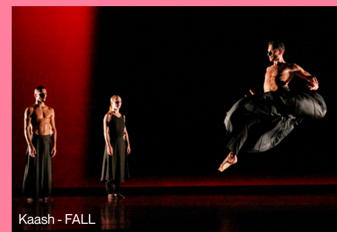
Kaash - FALL