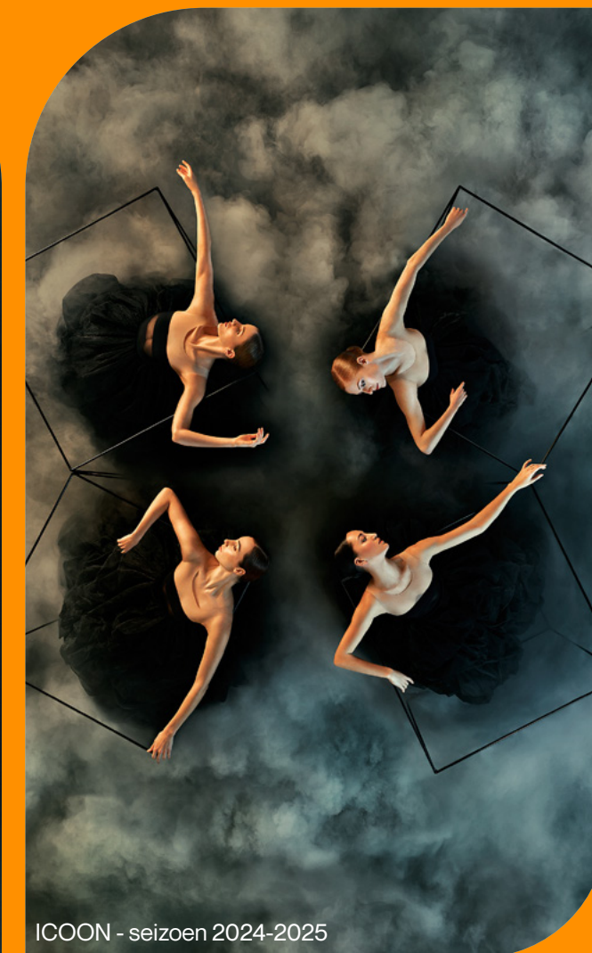
ICOON - seizoen 2024-2025