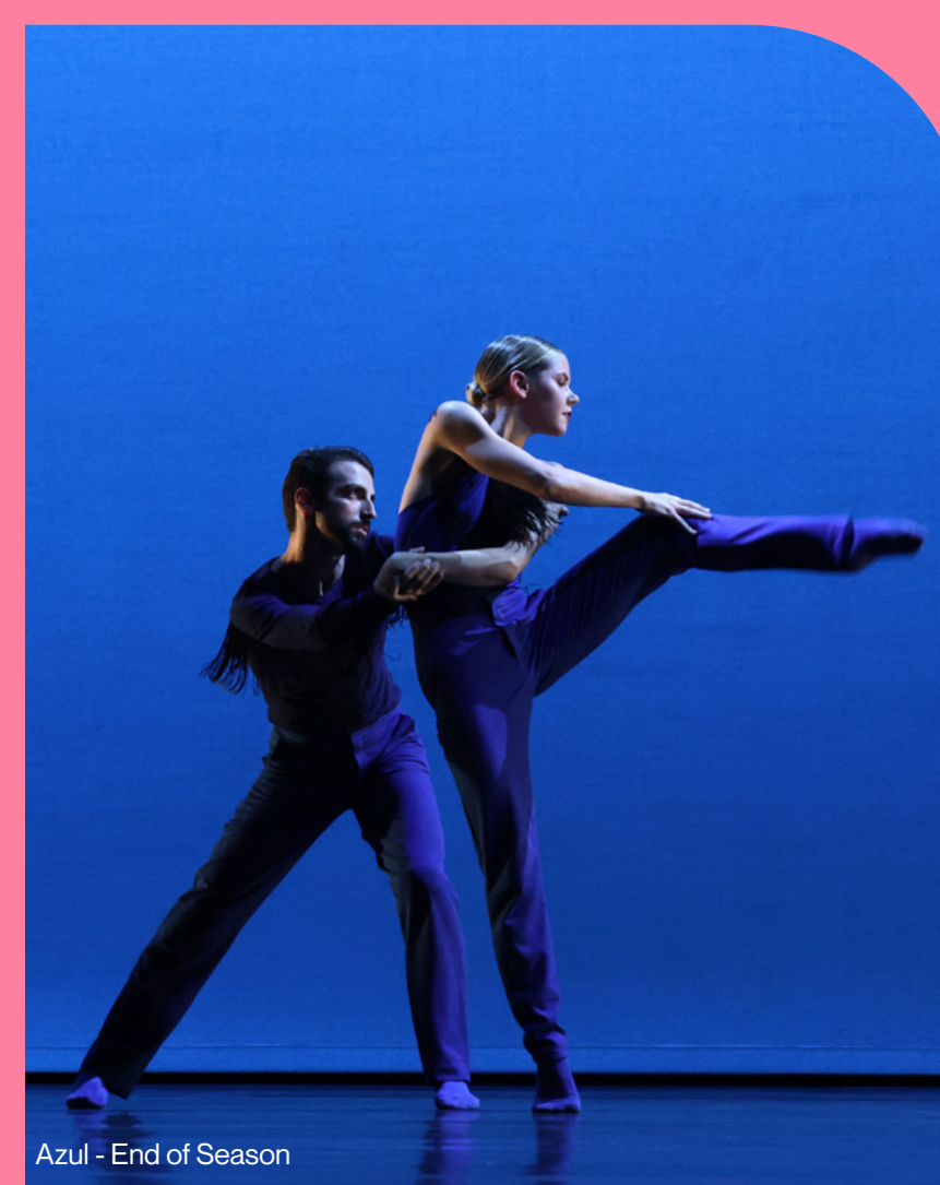
Azul - End of Season

Daarnaast hebben we de Netwerkovereenkomst Cultuurparticipatie 55+ ondertekend, in samenwerking met diverse Arnhemse partners: DrieGasthuizenGroep, Stichting Pleyade, SWOA (Stichting Welzijn Ouderen Arnhem), Phion, Nederlands Openluchtmuseum, Museum Arnhem, Rozet, Stichting Rijnstad en Humint Solutions. Dit programma, dat loopt van 2023 tot 2027, ondersteunt ouderen bij het actief deelnemen aan culturele activiteiten, het ontmoeten van elkaar en het ontwikkelen van hun talenten. Deze inspanningen dragen bij aan het bevorderen van welzijn en gezondheid onder ouderen.