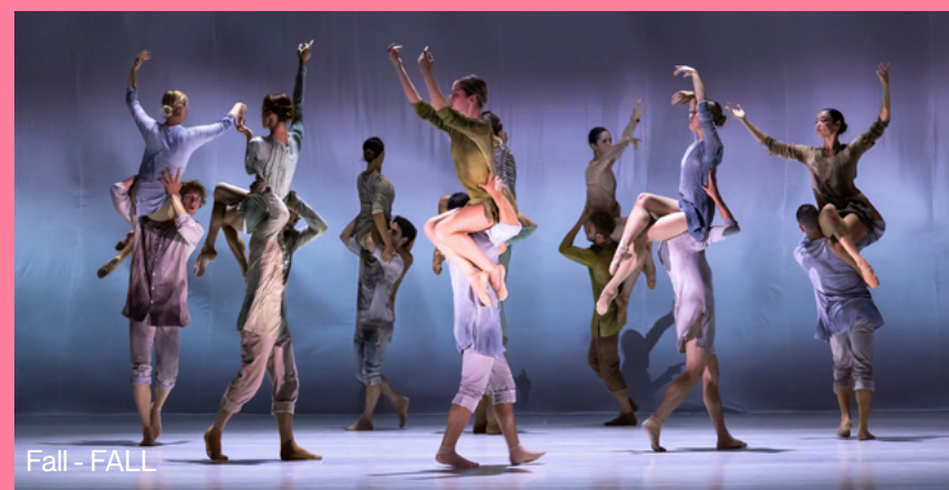
Fall - FALL