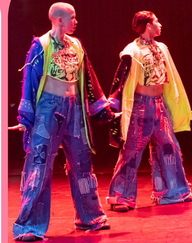
Illusion - HubClub'23

Digitalisering blijft een snelgroeïende trend en biedt kansen voor het realiseren van de Codes die wij onderschrijven, met name op het gebied van diversiteit en inclusie. Nieuwe of geoptimaliseerde middelen hebben de potentie om een breder en diverser publiek te bereiken, waarmee we op een andere wijze de danswereld kunnen ontsluiten.