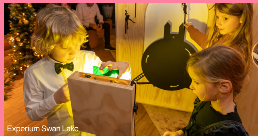
Experium Swan Lake