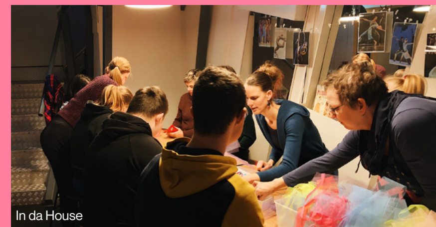
In da House