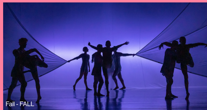
Fall - FALL