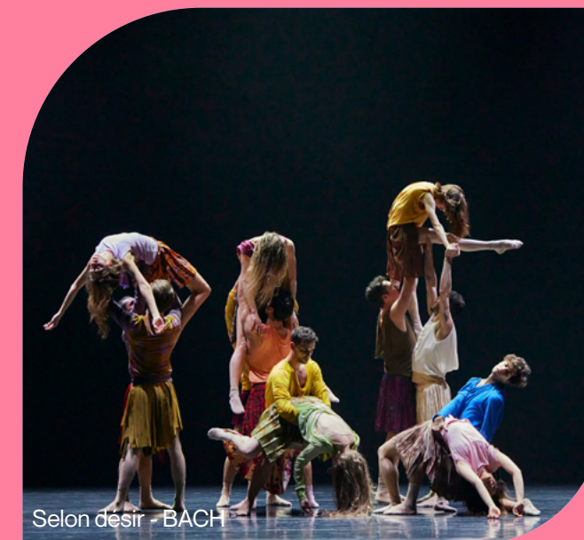
Selon désir - BACH