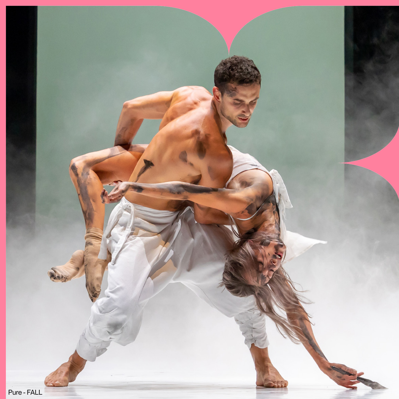
Pure - FALL

Introdans is gevestigd in het centrum van Arnhem en behoort tot de landelijke BIS-gezelschappen. Hare Koninklijke Hoogheid Prinses Margriet der Nederlanden is beschermvrouwe. Introdans ontvangt subsidie van Ministerie van Onderwijs, Cultuur en Wetenschap, de provincies Gelderland en Overijssel en gemeente Arnhem. Partners zijn Dirkzwager, Burgers' Zoo, DDJ de cijfers voorbij, Boutique Makelaar, Huis & Hypotheek, OK72, NAHV Accountants, VSBfonds, Fonds21, Fonds voor Cultuurparticipatie, De Onderwijsspecialisten, Stichting DOEN/VriendenLoterij Fonds, ELJA Foundation, Stichting FEMI en Stichting Het Gehandicapte Kind. Daarnaast weten we ons omringd door vele Vrienden. Al deze partners maken onze voorstellingen, educatie en talentontwikkeling mogelijk.