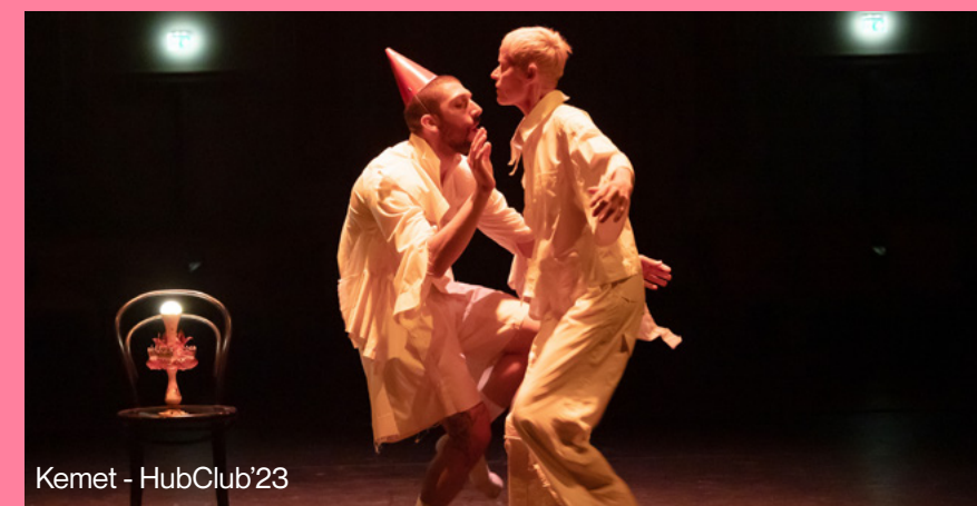
Kemet - HubClub'23