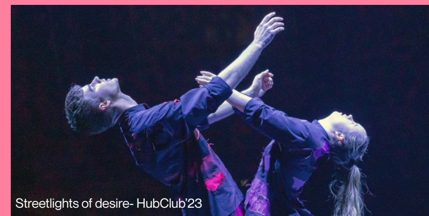
Streetlights of desire- HubClub'23