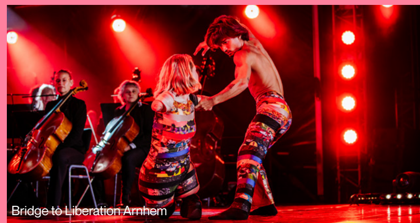
Bridge to Liberation Arnhem