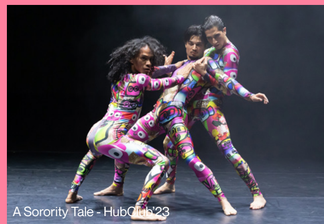
A Sorority Tale - HubClub'23