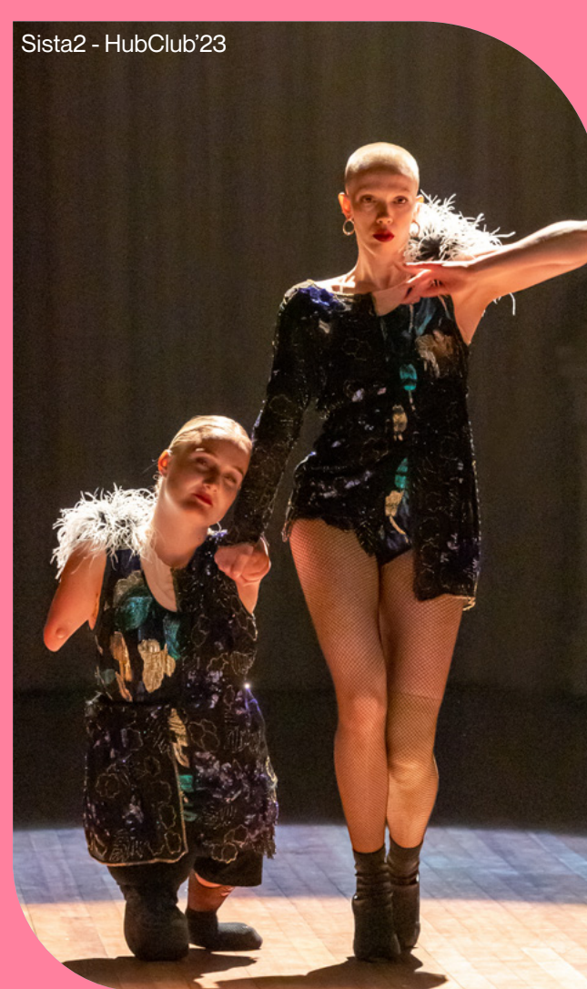
Sista2 - HubClub'23