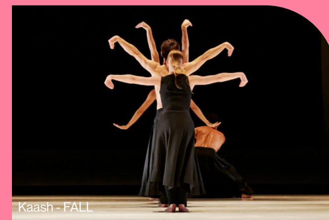
Kaash - FALL