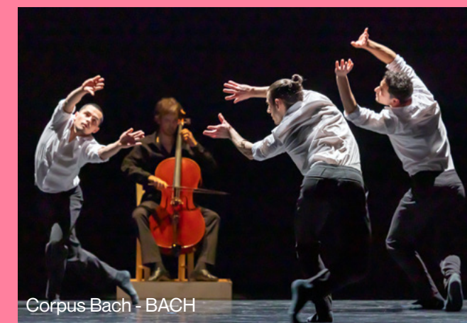
Corpus-Bach - BACH