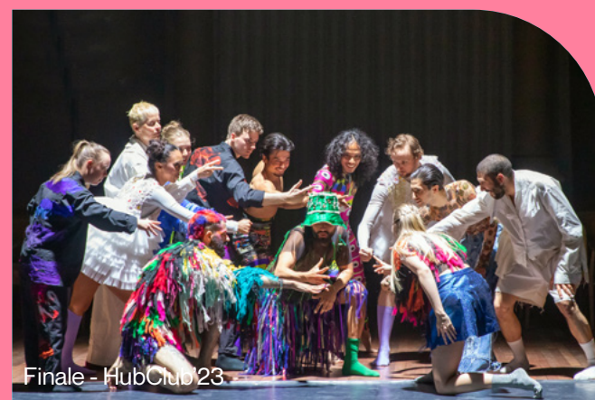
Finale - HubClub'23