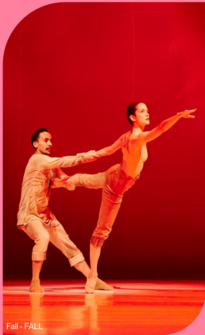
Fall - FALL