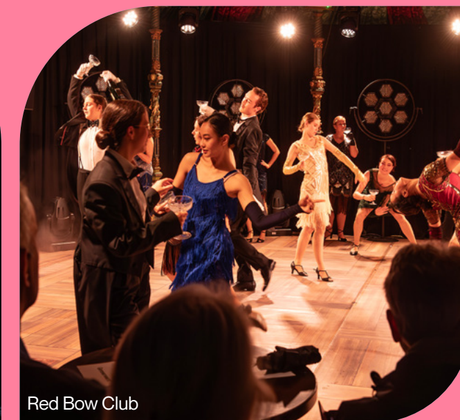
Red Bow Club